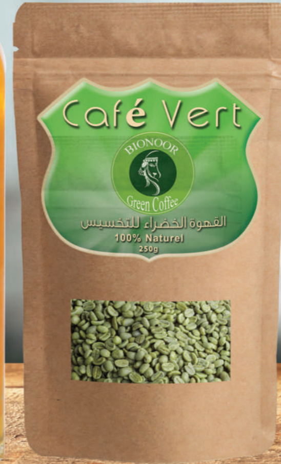
القهوة الخضراء للتخسيس