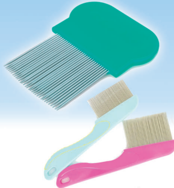
مشط ضد القمل