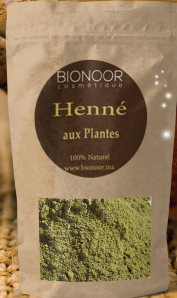
تبريمة الحناء بالأعشاب Henné aux Plantes