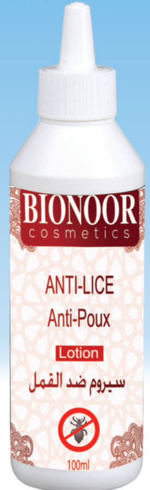
سيروم ضد القمل