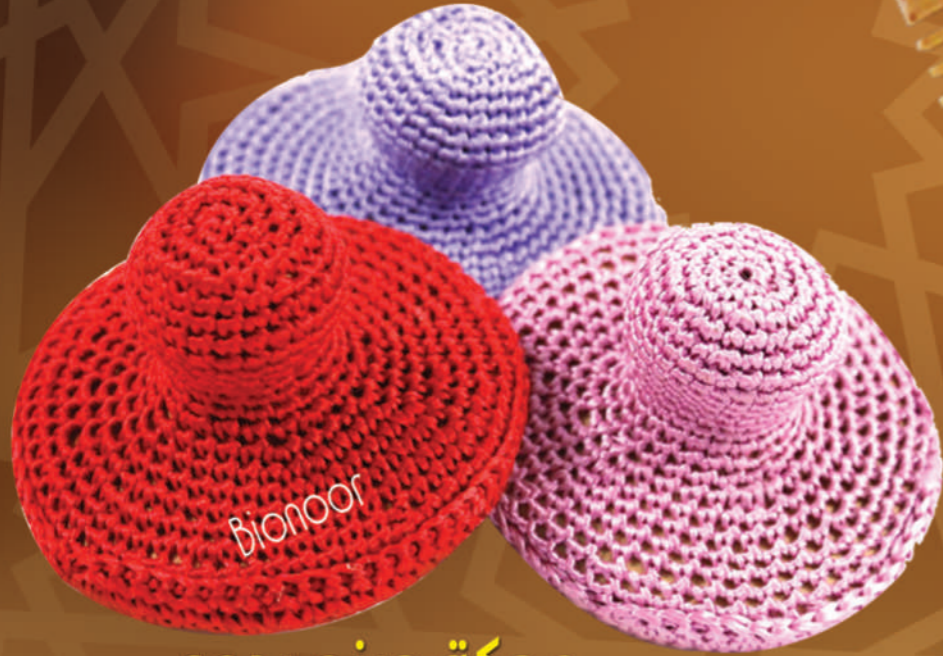
مكبة صنع يدوب M'HAKKA EN Sabra