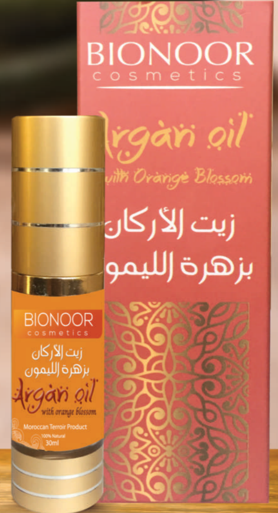
زيت الأركان بزهر الليمون 75%