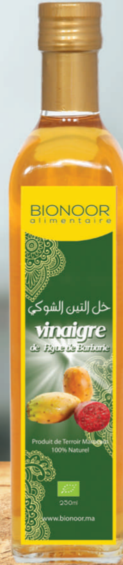
خل التين الشوكي

بيونور تقدم لكم برنامج التخسيس من الطب البديل و الأعشاب الطبيعية مجرية ومضمونة وسريعة المفعول لتخفيف الوزن والحصول على جسم صحي ورياضي هذا البرنامج يحتوي على أفضل المواد الحارقة للدهون بدون أي مواد كيميائية