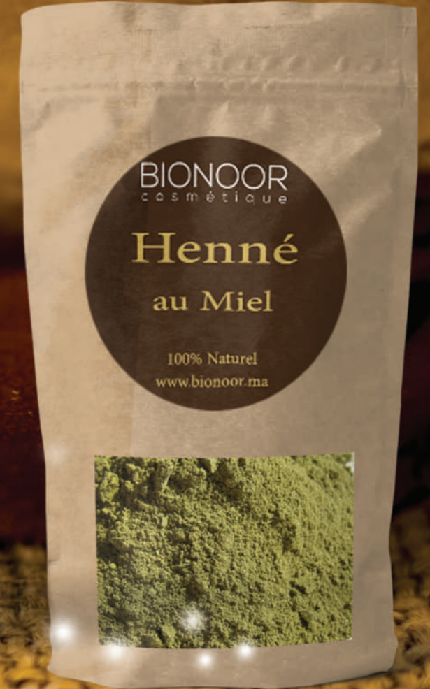
تبريمة الحناء بالعسل Henné au Miel