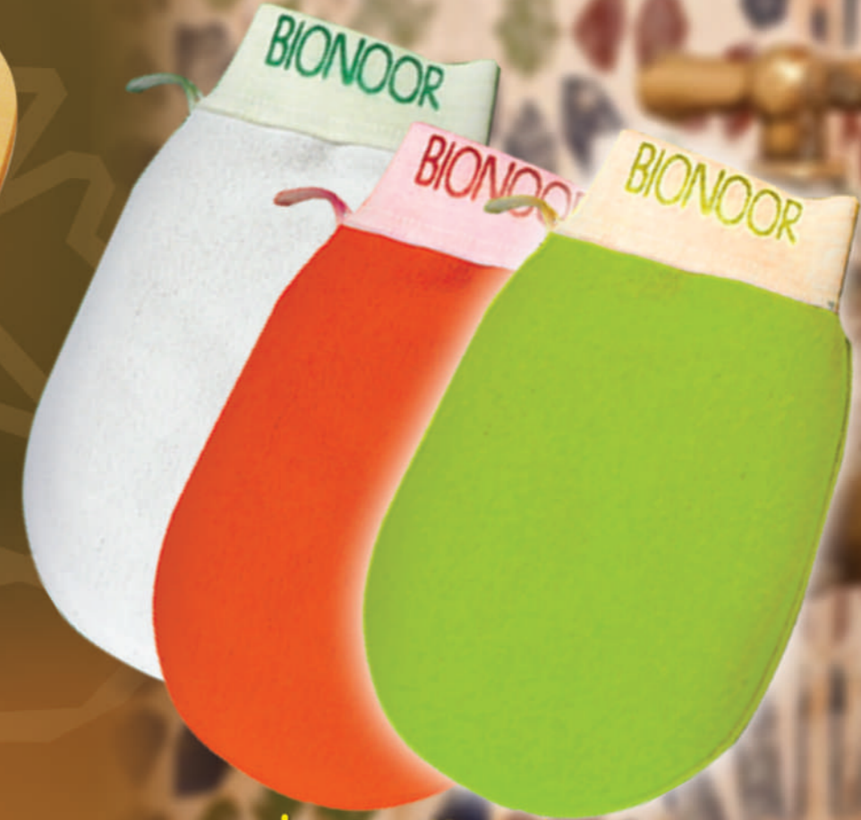
كبسال مقشبر Gant Kessal Efoliant