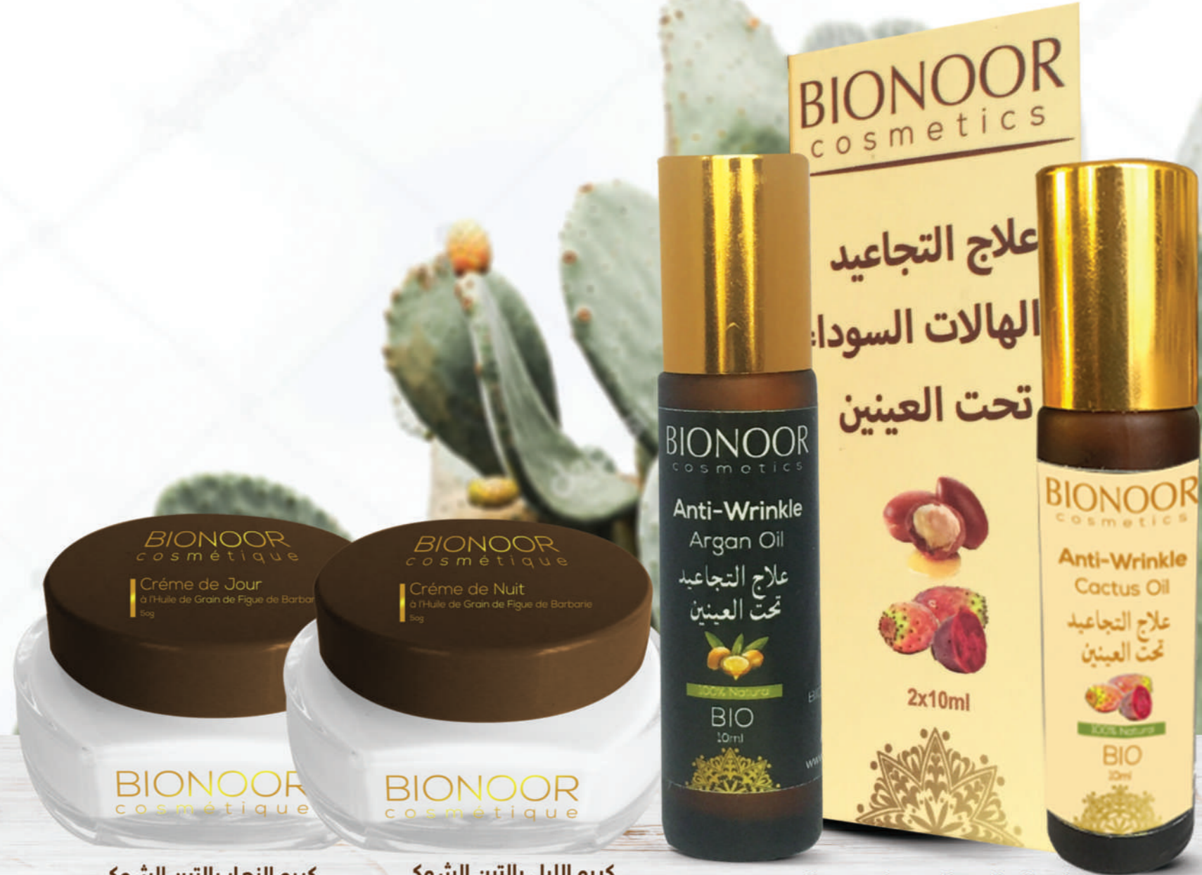
كريم النهار بالتين الشوكي Crème de jour Figue de Barbarie