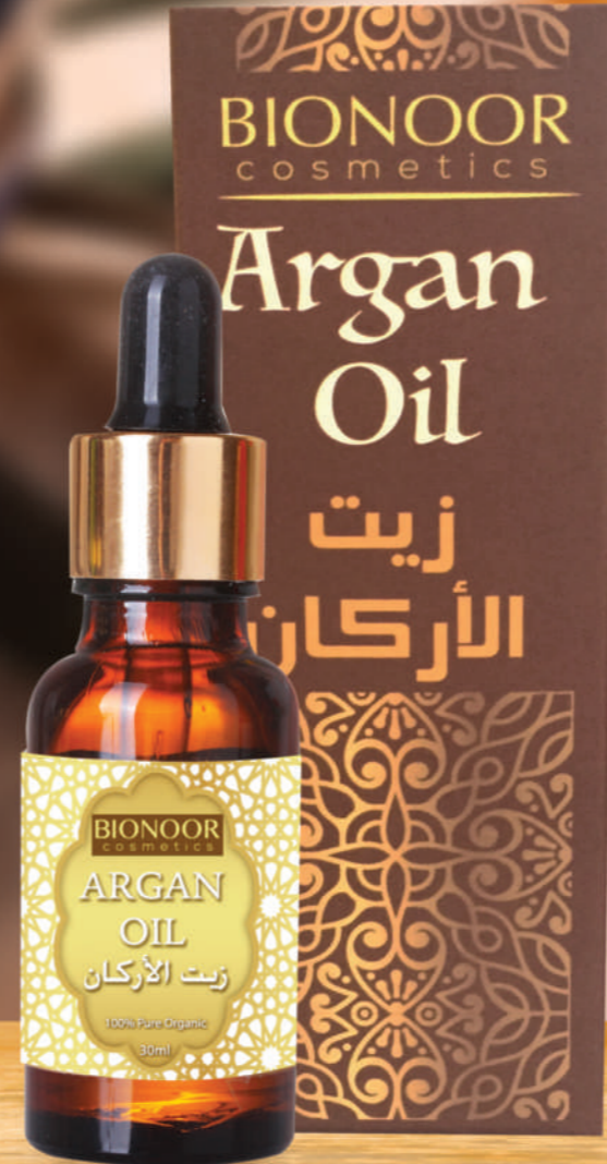
زيت الأركان 100%