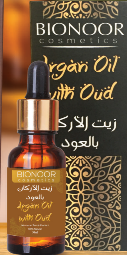
زيت الأركان بالعود 75%