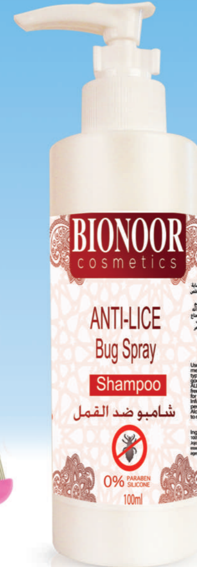
شامبو ضد القمل