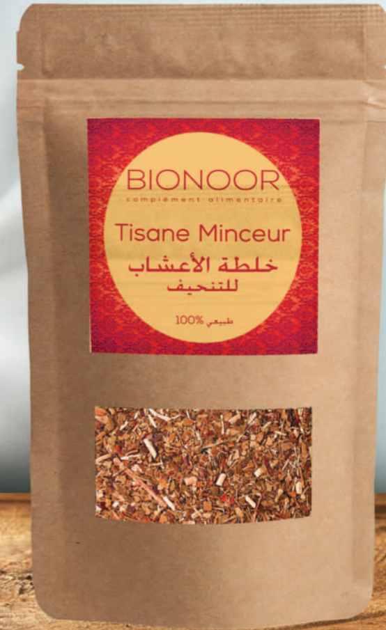
خلطة الأعشاب للتنحيف